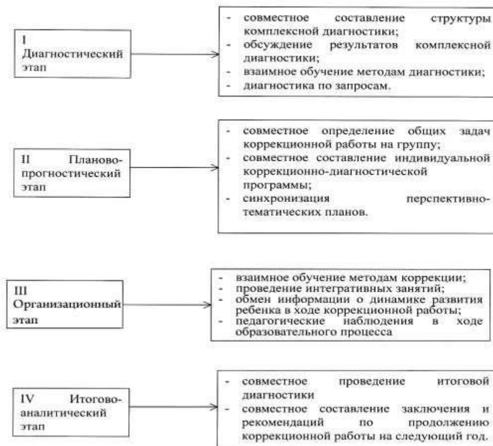
Рисунок 3. Система взаимодействия специалистов в процессе диагностики.

Данные комплексной диагностики каждого воспитанника заносятся в «Карту психолого-педагогического и медико-социального развития ребенка», в которой проектируется разработка Индивидуального коррекционного маршрута развития , в котором систематизируются все наблюдения и рекомендации специалистов, динамика развития ребенка.